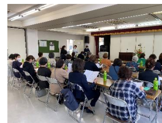
【総会】事業報告・収支決算・予算等、真剣に議事頂きました