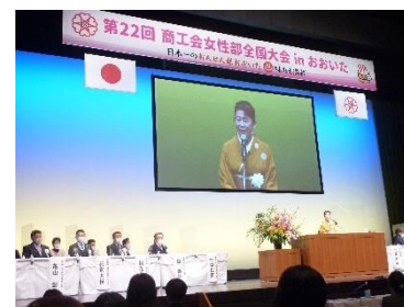
【全国大会】大会スローガンは「ようこそおんせん県おおいたへ～湧き出す女性パワーで真心のおもてなし～」 当日は篠栗町を含む全国2,670名の女性部が視聴しました。

私たち女性部の仲間になりませんか？モットーは、楽しい活動の中から新しい自分を発見！研修会や意見交換を通じ資質向上と豊かな地域づくりのために多彩な活動を行っています。ご都合に合わせて、参加は全て自由です。仕事や家事の無理のない範囲で、一緒に楽しく活動しませんか？ お問い合わせは商工会（☎947-4141）まで